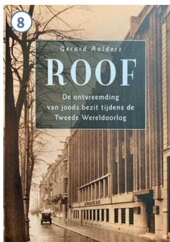
In de jaren negentig verschijnen diverse boeken en rapporten over de ontvreemding van Joods bezit tijdens de oorlog, waaronder Roof van Gerard Aalders, en het eindrapport van de Begeleidingscommissie onderzoek financiële tegoeden WOII in Nederland.

De afdeling waar Mobron werkt, ABN AMRO Art & Heritage, heeft een uitgebreide website waar bezoekers over allerlei bankhistorische thema’s kunnen lezen, waaronder de Tweede Wereldoorlog – inclusief archiefbeeld en tijdlijn. Het beleid rond het omgaan met de oorlog heeft zich eerst bewogen tussen de eigen rol bijna heldhaftig voorstellen en in de doofpot stoppen, maar sinds de jaren negentig is er veel meer sprake van transparantie, aldus Mobron. Zelf proactief naar buiten treden, dat is altijd beter, wil hij maar zeggen. ‘Zoals in feite ook recent is gebeurd met het slavernijonderzoek.’ <