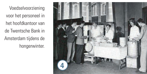
Voedselvoorziening voor het personeel in het hoofdkantoor van de Twentsche Bank in Amsterdam tijdens de hongerwinter.