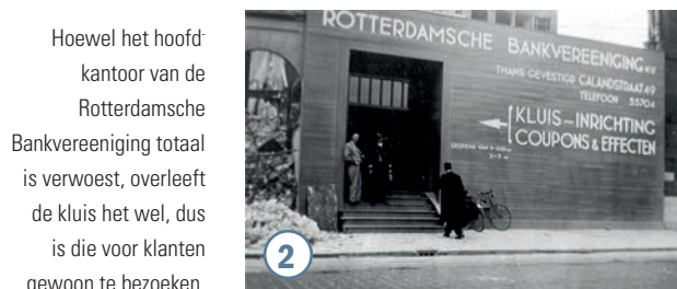
Hoewel het hoofdkantoor van de Rotterdamsche Bankvereniging totaal is verwoest, overleeft de kluis het wel, dus is die voor klanten gewoon te bezoeken.