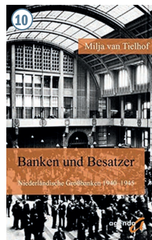
... en in 2007 in het Duits vertaald: Banken und Besatzer: Niederländische Großbanken 1940-1945.