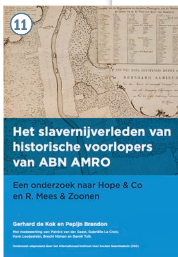
Het onderzoek Het slavernijverleden van historische voorlopers van ABN AMRO is vorige maand verschenen.

> Het onderzoek Het slavernijverleden van historische voorlopers van ABN AMRO (foto 11) is te downloaden op bit.ly/onderzoek-slavernijverleden .