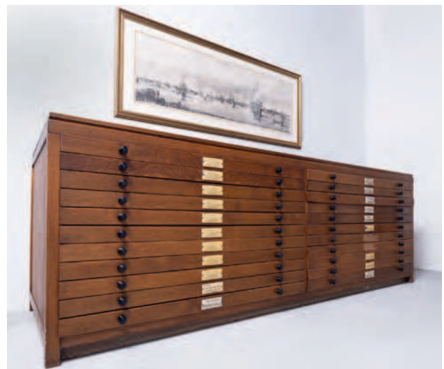
Ladenkast voor bouwtekeningen van de Nederlandsche Handel-Maatschappij, circa 1926.