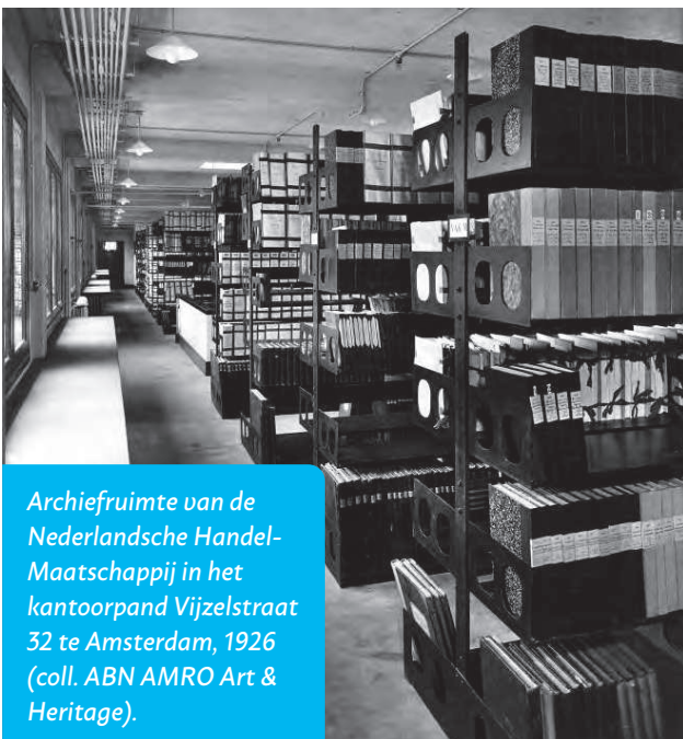
Archiefruimte van de Nederlandsche Handel-Maatschappij in het kantoorpand Vijzelstraat 32 te Amsterdam, 1926.

Is een archief eenmaal gelokaliseerd, dan is er de kwestie van het verkrijgen van toegang en inzagemogelijkheden. In het bedrijfsleven zit er op de toegankelijkheid om begrijpelijke redenen een spanning. Belangen als bescherming van